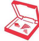
በምግብ የተበላሸ ካርቶን