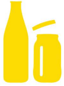
ጠርመስ እና አቦራ