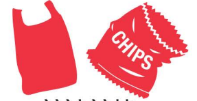
ለስላሳ ላስቲክ (ወይም ወደ REDcycle ቅርጫት ይጨምሩት)